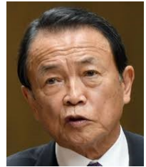
「政治に関心 持たず生きて いける国は良 い国です」と、 自民・麻生太郎氏の本音

「政治に関心がないのはけしからん」とえらそうに言う人もいる。しかし政治に関心を持たなくても生きていけるといえるのは良い国です。考えなきや生きていけない国のほうがよほど問題なんだ。(三重県桑名市内での講演で)(朝日新聞報道)