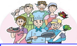
仲間の団結で営業を守ろう