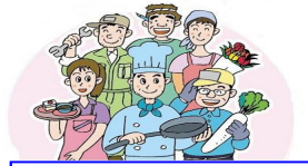
仲間の団結で営業を守ろう