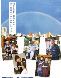
民商・全商連 70年のあゆみ