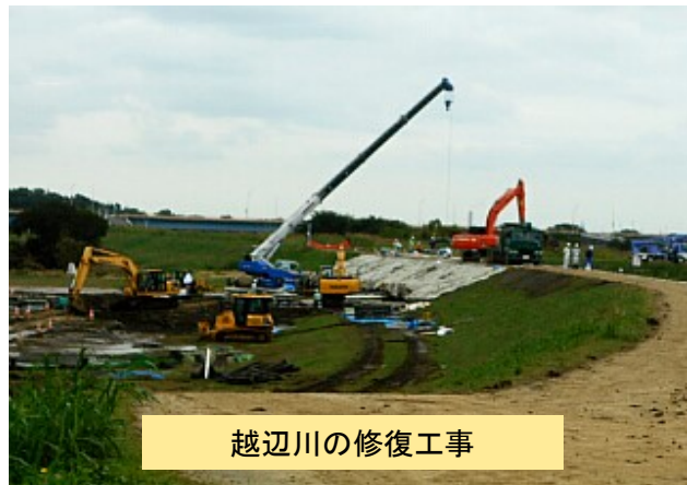
越辺川の修復工事

懸念されています。喫茶店や居酒屋やスナックなどに影響が出ています。 また、消費税の申告を一般課税で行っている方は、帳簿付けを8%と10%に分けなければなりませんし計算も9月迄と10月以降に分けて記帳しなければいけなくなりまして。来年の申告や消費税で悩んでいる業者に声をかけて民商の仲間を増やしましょう。