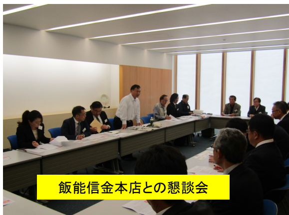
飯能信金本店との懇談会