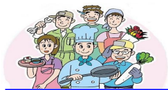
仲間の団結で営業を守ろう